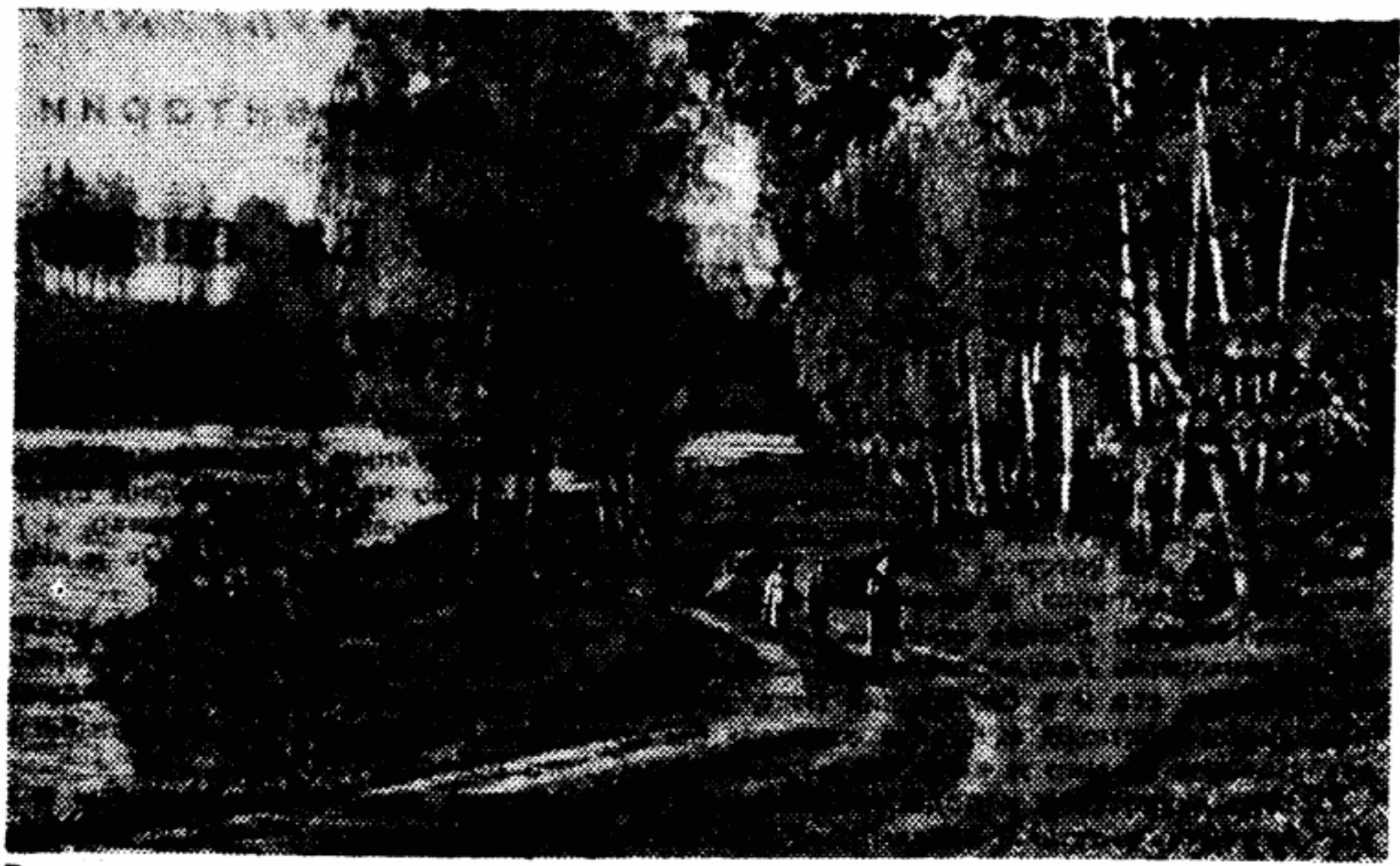
В подмосковном лесу.